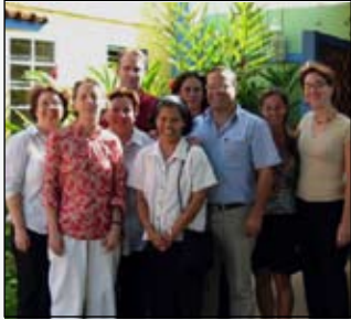
L'équipe SUCO au Nicaragua

nicaraguayens vivent dans la pauvreté, en milieu rural ce pourcentage augmente à 77%. La FAO classe le pays dans la catégorie 4 (l'avant-dernière) des pays avec le plus haut taux de malnutrition au monde. On estime que 40% de la population nicaraguayenne vit avec moins de 1$US/jour et selon une étude du procureur pour l'enfance, 45% des enfants souffrent de malnutrition et 30% souffrent d'un retard de croissance.